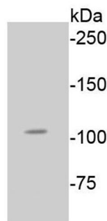
Fig. 1. Western blot analysis of Phospho-Rb(Ser807) on A549 cell lysates using anti-Phospho-Rb(Ser807) antibody at 1/1,000 dilution.